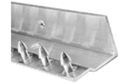
MaxBullet Acero Inoxidable Disponible sobre pedido.