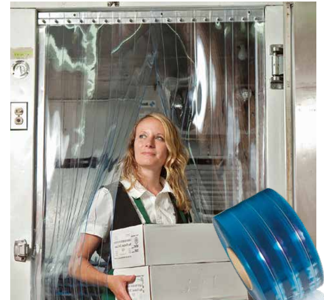
En esta foto, tira de 305 mm (12") de ancho.

Todas las medidas son nominales. Pueden variar \pm 10\% .