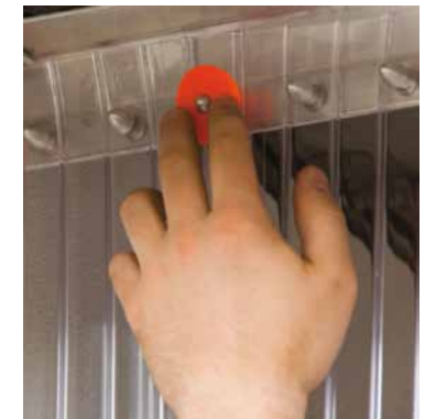
Discos fluorescentes de seguridad. MODELO: 09-477104-168.