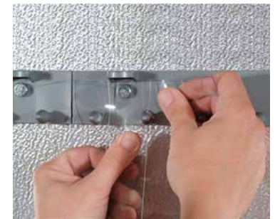
MaxBullet HTP Plata ya instalado.