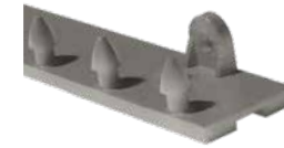
MaxBullet HTP Plata Plástico.